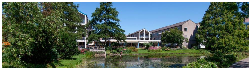
De Tien Gemeenten

De Tien Gemeenten is gelegen aan de rand het van oude centrum van Purmerend, recht tegenover het stadspark. De locatie bestaat uit 45 zorgappartementen, een afdeling met 14 plaatsen voor licht dementerende bewoners en 3 woongroepen. De locatie is omringd door een mooie tuin met diverse terrassen, waar het goed toeven is. In De Vijver, het buurtrestaurant van De Tien Gemeenten, kunnen bewoners en omwonenden dagelijks terecht voor koffie/thee en verse maaltijden uit eigen keuken.